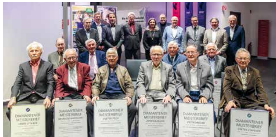
Unsere Diamantenen Meister.

Weitere Infos unter: handwerk-region-karlsruhe.de