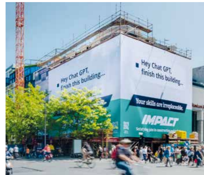
Künstliche Intelligenz funktioniert nicht überall ... Was für immer bleibt: Das Handwerk.