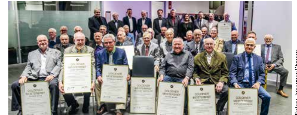
Unsere Goldenen Meister.