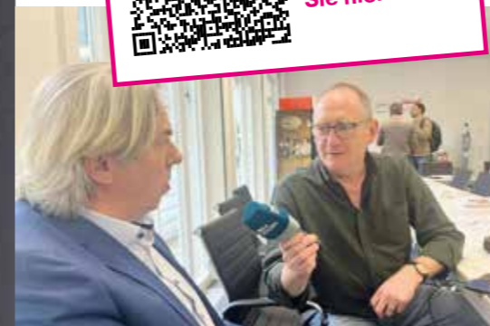
Pressegespräch der Verbände-Allianz Karlsruhe (Kreishandwerkerschaft Region Karlsruhe, DEHOGA Karlsruhe und Handelsverband Nordbaden) im RAUM13 zu Fachkräftemangel, angespannter Wohnraumsituation, Bürokratieabbau und Zukunft Innenstadt. Danke an Baden TV, SWR 4 und BNN für die Berichterstattung.

Pressekonferenz der Verbände-Allianz im RAUM13