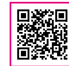
Warum Mitarbeitende kündigen....

Darum ist gesundes Führen exorbitant existenziell! Damit zeigen Führungskräfte den Mitarbeitenden echte Wertschätzung. Was ist damit gemeint, sich selbst und die Mitarbeitenden gesund zu führen? Sehen Sie sich dazu mein Video an: